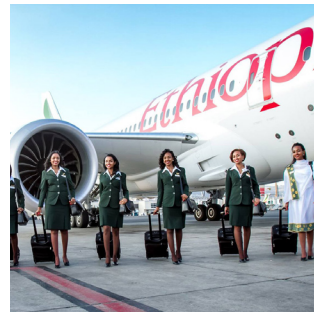
13 | Éthiopie : Trafic aérien