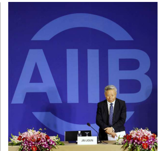
26 | 5 pays africains rejoignent BAII