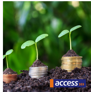
21 | Nigéria : Obligations vertes